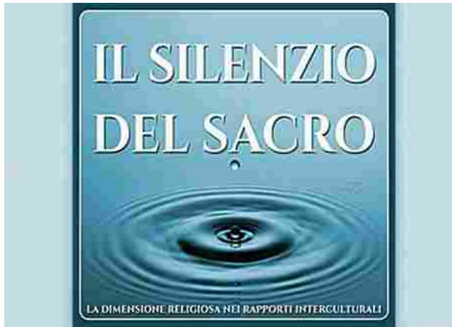
Il convegno internazionale 'Il Silenzio del Sacro' che si terrà a Bari dal 31 marzo al 2 aprile prossimi CLICCA PER INGRANDIRE +

Sono i giovani under 30 e i meridionali i più aperti al confronto con le persone che praticano altre religioni. E' questo uno dei dati che emerge da un sondaggio Ipsos commissionato dalla Fondazione Intercultura in occasione del convegno internazionale "Il Silenzio del Sacro" che si terrà a Bari dal 31 marzo al 2 aprile prossimi.